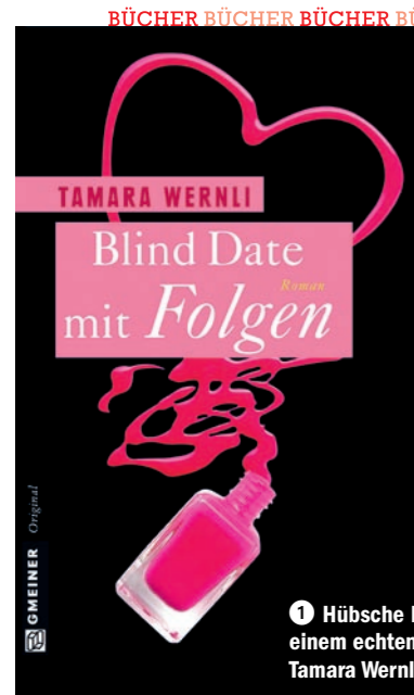
1 Hübsche Idee: Was passiert, wenn man sich zu einem echten Blind Date, also im Dunkeln verabredet? Tamara Wernli hat das jetzt aufgeschrieben