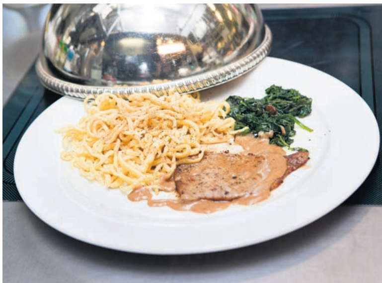
Kalbsplätzli mit Spätzli und Spinat